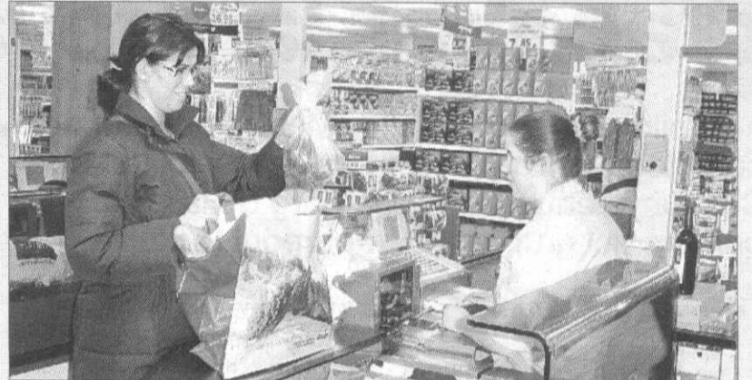
► Una clienta omple la bossa a la caixa dels grans magatzems.

A tot això hi cal afegir que, per fer la bossa més atractiva, l'establiment n'ha fet dissenyar quatre models que evocuen les quatre