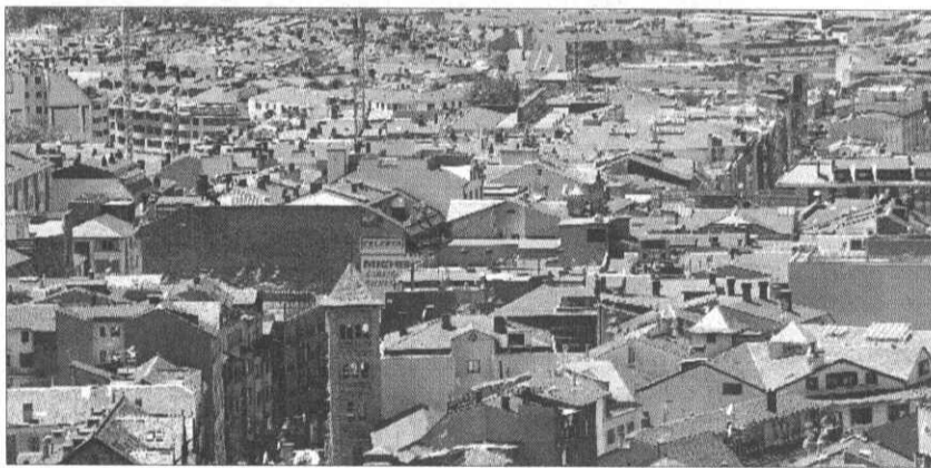
► Una vista aèria d'Andorra la Vella.

SITESA és una companyia especialitzada en les aplicacions dels sistemes d'informació geogràfica (SIG), especialment útils per a les administracions públiques. Així mateix, és capaç d'implantar sistemes corpora-